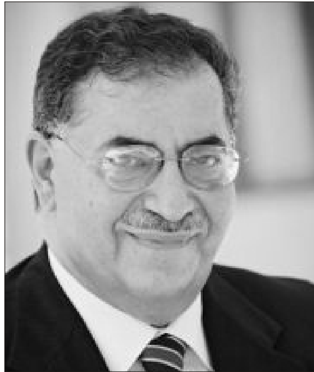
"Vaşinqton görüşlərində demokratiya, insan haqları ilə bağlı müzakirələr oldu"

- Bu gün Azərbaycanda Amerikanın yalnız səfirliyinin qalması okeanın o tayında necə dəyərləndirilir? Bakıdakı təsisatların qapadılması