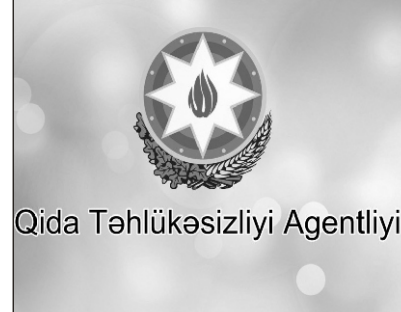
Qida Təhlükəsizliyi Agentliyi

Eyni zamanda nəzarət tədbirlərinin gücləndirilməsi üçün Azərbaycan Respublikasının Qida Təhlükəsizliyi Agentliyi tərəfindən Gürcüstan Respublikasının Samtsxe-Cavaxetiya regionundan gələn və ya həmin ərazidən tranzit keçən nəqliyyat vasitələrinin gömrük keçid məntəqələrində dezinfeksiya edilməsi ilə bağlı Dövlət Gömrük Komitəsinə aidiyyəti üzrə müraciət olunub".