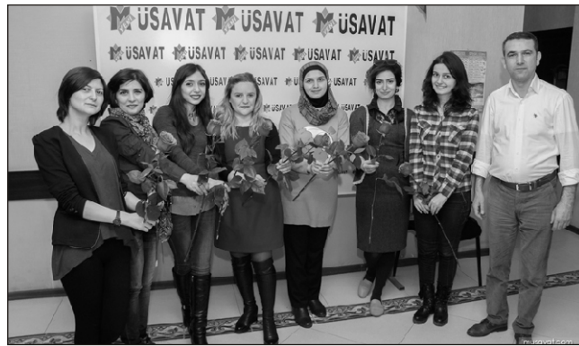
Gülüşürük. Arzularda belə kişilər bizdən bir addım öndədir. Spontan atmacaları ilə hər zaman