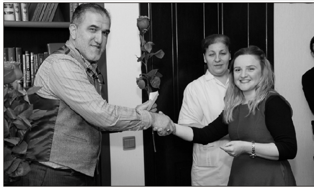
verilməsini istədik. Xanımlara 5 min, kişilərə 10 min..."