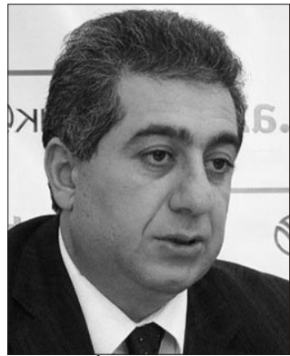
Qubad İbadoğlu: "SOCAR-ın maliyyə vəziyyəti pisləşəcək"