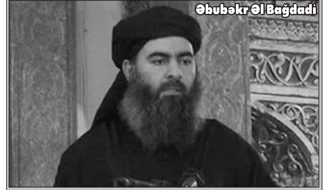
Əbubəkr Əl Bağdadi

Layihə Milli Məclisin plenary iclasına tövsiyə olunub. □ Hazırladı: E.PASASOY