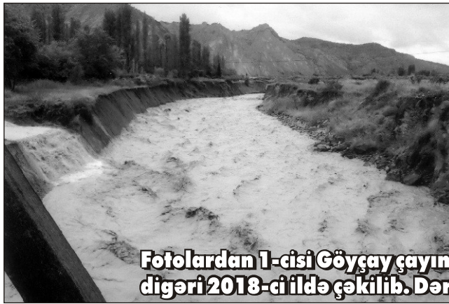
Fotolardan 1-cisi Göyçay çayının eyni yerində 2002-ci, digəri 2018-ci ildə çəkilib. Dərinliyin fərqi azı 20 metrdir.