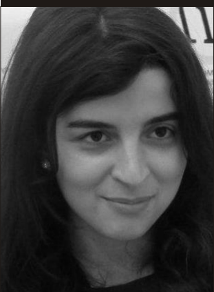
Həcər Abbaslı Ümid Partiyası Gender Bərabərliyi şöbəsinin müdiri

Zəif fərdlər həm fiziki, həm də maddi cəhətdən cəmiyyətdə, işdə tutduğu vəzifədən asılı olmayaraq zorakılığa, qeyri insani və insan ləyaqətini alçaltdıraraq rəftara məruz qalaraq inkişafdan, arzulanacağı gələcəyə sahiblənməkdən məhrum olurlar. Bu həyatın bütün sferalarında - həm iş həyatında, həm ailədə, həm məktəbdə, həm cəzaçəkmə müəssisələrində, həm də digər bu kimi yerlərdə mövcuddur.