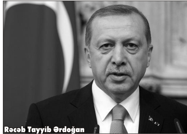
Rəcəb Tayyib Ərdoğan

"Putin kimi şəxslər ancaq güc dilini başa düşürlər"