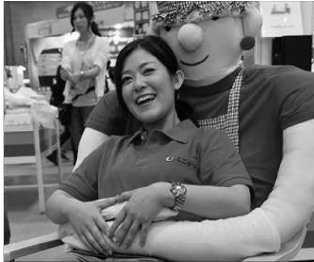
ayaqyoluna getmənin vaxtını xatırladan kukla da nümayiş etdirilib. Həmin kukla eyni zamanda yaşlı adamlara xoş gələn keçmiş yapon mahıllarını da ifa edə bilər.

"Unicare" firması Tokioda keçirilən Beynəlxalq Ev Əşyaları və Komfort sferasında ilginç kreslo təqdim edib. Özəl olaraq yaşlı və tənha insanlar üçün nəzərdə tutulmuş kreslonun dizaynı olduqca ilginçdir. Belə ki, oturacaq hissə gülən və uzun qolları ilə adamı qucaqlayan adam formasındadır. Dizaynerlər hesab edir ki, kreslo yaşlı adamlara kiminsə tərəfindən qucaqlandıklarını hiss etdirəcək və bu, onlara yalnızlıqlarını unutturacaq. "New-York Daily News"-ün xəbərinə görə, kreslonun ümumi məbləği 420 dollardır. "Unicare" təmsilçiləri deyir ki, kreslo eyni zamanda əlillər üçün də ideal vasitədir. Sərgidə eyni zamanda sahibinə dərman qəbulunun və