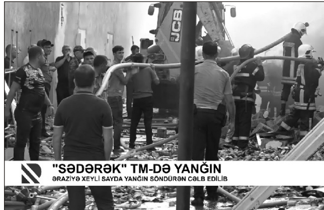
"SƏDƏRƏK" TM-DƏ YANGIN ƏRAZİYƏ XEYLİ SAYDA YANGIN SÖNDÜRƏN CƏLB EDİLİB

Daxili İşlər Nazirliyinin mətbuat xidmətindən verilən məlumata görə, xilasetmə zamanı polis əməkdaşlarından da bir neçəsi tüstüdən zərərçəkib. Rəsmi məlumata görə, "Sədərək"də baş vermiş yanğın zamanı təcili tibbi yardıma müraciət edənlərin ümumi sayı 16 nəfər olub. Onlardan 6-na yerində yardım edilib, 10 nəfər isə xəstəxanaya yerləşdirilib. Həmin şəxslərdən biri yanğın baş verən ticarət mərkəzinin əməkdaşı olub. Qalanlar isə yanğının söndürülməsində iştirak edən Fövqəladə Hallar və Daxili İşlər nazirliklərinin əməkdaşları olublar. Müraciət edənlərə tibbi yardım göstərildikdən sonra evə buraxılıblar.