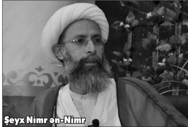
Şeyx Nimr ən-Nimr