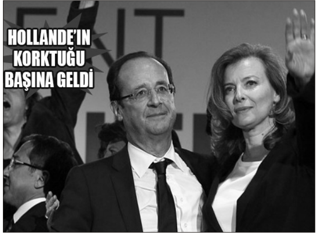
HOLLANDE'İN KORKTUĞU BAŞINA GELDİ

Keçmiş birinci xanımın sözlərinə görə, Olland hər gün ona 29 mesaj yazmış və barışmasını istəyirmiş. Hər axşam isə onu yeməyə dəvət edirmiş. Lakin o, xəyanəti qəbul etməyib və bir daha onun yanına qayıtmayıb.