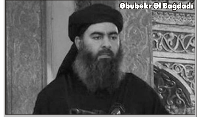
Əbubəkr Əl Bağdadi

Layihə Milli Məclisin plenary iclasına tövsiyə olunub. □ Hazırladı: E.PASASOY