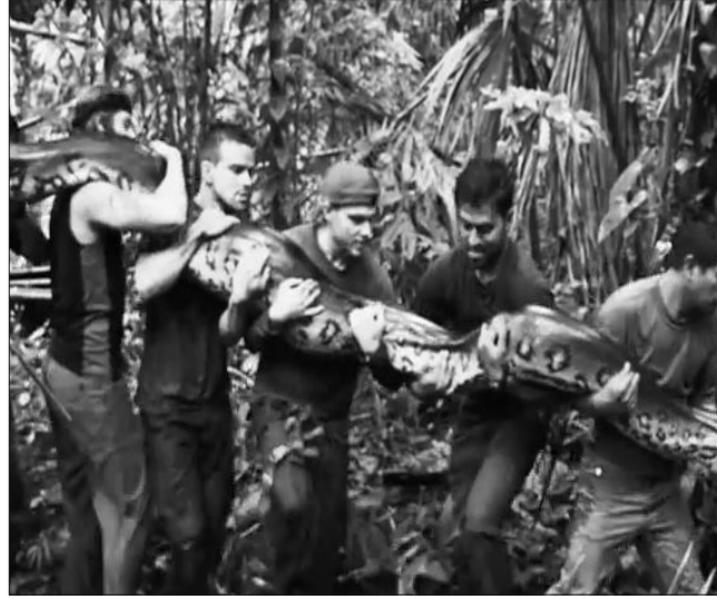
şey ilanın mənim üzümün qarşısında geniş açılan ağzı idi. Ondan sonra hər şey qaraldı”.

“Discovery Channel”in efirində nümayiş etdirilən eksperiment zamanı ilginç hadisə baş verib. Belə ki, anakonda eksperimenti həyata keçirən alim “yeməkdən” imtina edib. İri bir ilan tərəfindən yeyilmənin necə bir hiss olduğunu araşdırmaq istəyən alimin adı isə Pol Rozoli olub. Geyindiği xüsusi kostyum onun sağ və zərərsiz qalmasına yardım edəcəkdi. Amma anakonda araşdırma qrupu aldada bilməyib. Belə ki, ilan onu yeməkdən imtina edib, sadəcə, qolunu və çiyinini möhkəm sarıb. “Sarılımlar” möhkəmləndə isə alim özünü ilandan azad edib və eksperimenti dayandıraraq. Ötən ilin dekabrında alim təcrübə zamanı bir saat ilanın içində olmağı bacarıb. Bu təcrübə ilə bağlı o, təəssüratlarını belə ifadə edib: “Axırıncı xatırladığım