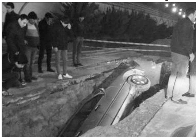
Bəs belə durumda sürücü qurumu məhkəməyə verə bilərmi?

aparılıb. Qazıntı işləri aparılarkən, bütün tikinti və texniki normalara əməl olunub. Qazıntı aparılan sahənin yaxınlığında məlumatverici lövhə, xəbərdarlıq nişanları və qoruyucu lentlər qoyulub. Mətbuatda yayımlanmış fotosəkillərdə də məlumatverici lövhələrin və qoruyucu vasitələrin mövcud olması əksini tapıb. Bu xəbərdarlıq vasitələr gecə saatlarında hərəkətdə olan bir nəqliyyat vasitəsi tərəfindən dağıdılıb. Bundan sonra hərəkətdə olan digər nəqliyyat vasitəsi - "Mercedes" markalı avtomobil xəndəyə düşüb. Hadisə yerinə dərhal "Azərsu" ASC-nin əməkdaşları və texnikası cəlb olunub. Xüsusi texnika vasitəsilə avtomobil xəndəkdən çıxarılıb".