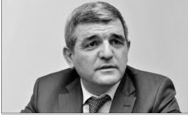
Fazil Mustafa: “Aqressiyanın artmasında müəyyən barışmaz müxalifət ünsürlərinin də rolu böyükdür”

rək qazana bildim. Ona görə də əslində hakimiyyət daha çox maraqlı olmalıdır ki, aqressiya azalsın”.