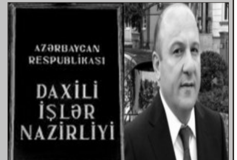
AZƏRBAYCAN RESPUBLİKASI DAXİLİ İŞLƏR NAZİRLİYİ