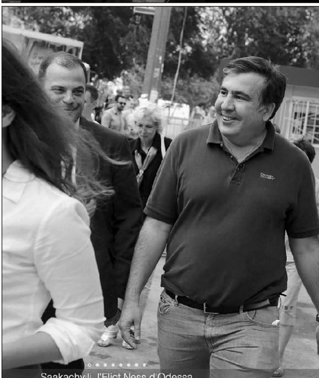
Saakaşvili. l'Elicit Ness d'Odessa

verən Saakaşvili hakimiyyət dəyişikliyinə bir müddət sonra prezident müşaviri postuna gətirildi. Ukraynada hər kəs onu "ABŞ-ın Kiyevdəki əli" kimi qəbul edir. Vətəndaşların çoxu inanır ki, bu "əl" bir zamanlar Gürcüstan üçün etdiyi böyük işləri Ukrayna üçün də etmək iqtidarındadır. ABŞ-ın siyasi hakimiyyəti ilə özəl münasibətləri, üstəlik, gerçəkləşdirmək istədiyi projeləri çox ustalıqla təkcə ölkənin deyil, dünyanın diqqət mərkəzinə gətirmək bacarığı Saakaşvilinin Ukraynada da başanlı olacağına inamı artırır.