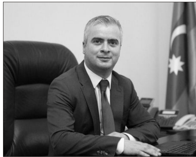
"Sığorta aqrar sahəyə biznes marağını artıracaq, investisiyaları təşviq edəcək"

- Özəl əməkdaşlığı iki istiqamətdə olacaq. Birincisi, idarəedici şirkətin səhmdarları özəl sığorta şirkətləri olacaq. Onlar satışla məşğul olacaqlar. Satdıqları sığorta məbləğindən onlar faiz əldə edəcəklər. Totalım ki, hər 100 manatdan 10 faiz. Sığorta hadisəsi baş verdikdə isə idarəedici şirkətin cəlb etdiyi müstəqil ekspertlər qiymətləndirmə aparacaqlar. Bu ekspertlərin hava-iqlim şəraiti haqqında məlumatlara çıxışı olacaq. Yəni onların sığorta hadisəsinin (yağış, dolu və sair) baş verməsini bilmələri üçün harasa getmələrinə, yaxud fermerin müraciət etməsinə ehtiyac olmayacaq - bu məlumatlar elektron formada onlara veriləcək. Bundan sonra onlar hadisə yerinə gedib, elektron resurslar vasitəsilə sığorta hadisəsini qeydə alacaqlar. Bunun əhəmiyyəti on-