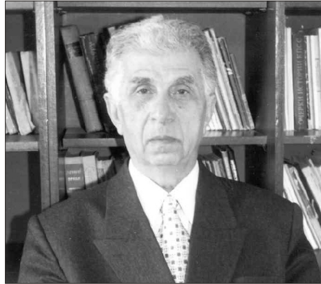
"Söhbət bu kişinin qoyub getdiyi irsi öyrənmək və bu millətə öyrətməkdən gedir"