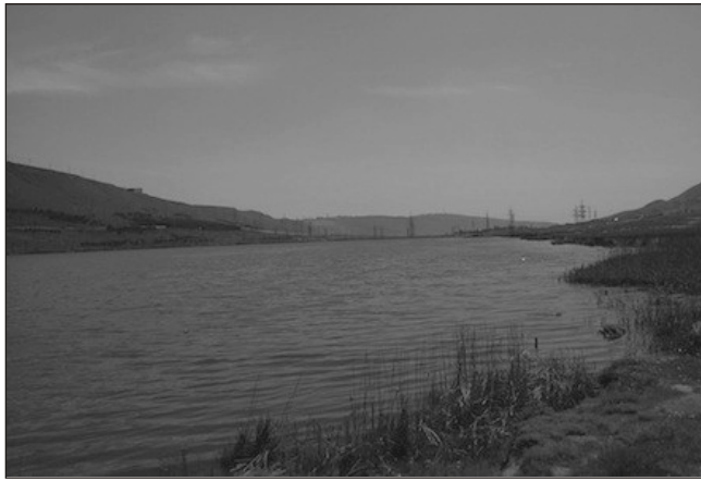
qanun pozuntusu halları olan 121 gölün fəaliyyəti dayandırılıb, torpaq sahələri kənd təsərrüfatı dövrüyyəsinə qaytarılıb. Balıq gölünün 269-u barədə inzibati protokollar yazılıb, cinayət əməlinin

121 gölün fəaliyyəti dayandırılıb, torpaq sahələri kənd təsərrüfatı dövrüyyəsinə qaytarılıb; bəzi ekspertlər hesab edir ki, həmin göllərin fəaliyyətini leqallaşdırmaq lazımdır