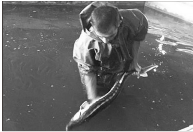
əlamətləri aşkar olunan 25 göllə bağlı sənədlər Daxili İşlər Nazirliyinə təqdim edilib.

"Yeni Müsavat" xatırladır ki, süni göllərlə bağlı məsələ hələ 2016-cı ildə kənd təsərrüfatı üçün