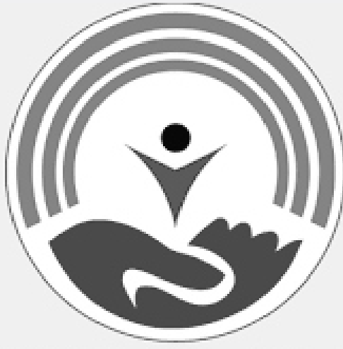
Dövlət Məşğulluq Xidməti

Nazirlik bildirir ki, işsiz və işaxtaran vətəndaşların məşğulluğunun təminatı istiqamətində aktiv məşğulluq tədbirləri ildən-ilə gücləndirilməklə, əmək bazarı proqramlarının əhatə dairəsi genişləndirilir, həmçinin bu sahədə bir sıra yeni proqram və layihələr də reallaşdırılır: "Xidmət 2018-ci ildə əvvəlki ilə müqayisədə 8,1 faiz çox olmaqla 51 774 nəfər, 2019-cu ilin birinci rübündə isə ötən ilin müvafiq dövrü ilə müqayisədə 13,2 faiz çox olmaqla 34 minə yaxın çox işsiz və işaxtaran şəxsi münasib işlərlə təmin edib. Ötən il özünüməşğulluq proqramına cəlb edilənlərin sayı 2017-ci ilə müqayisədə 6,5 dəfə çox olmaqla 7 896 nəfər təşkil edib. Onlardan biznes planlarını uğurla müdafiə edən 7267 nəfər proqramın iştirakçısı olub. Cari ilin ilk rübündə