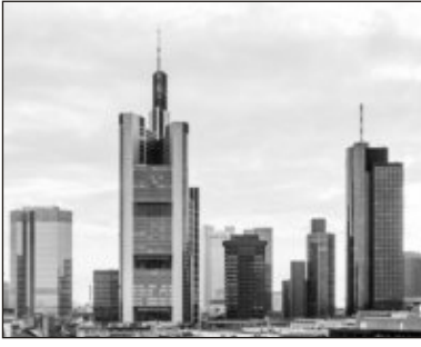
bu göstəricilərdən xeyli yüksək olub.

2018-ci ilin birinci rübündə Aİ ölkələrində mənzillərin qiyməti keçən ilin müvafiq dövrü ilə müqayisədə 4,7 faiz və əvvəlki rüblə müqayisədə 0,7 faiz artıb. AVROSTAT-ın (Avropa İttifaqı Statistika İdarəsinin) məlumatına görə, Macarıstanda qiymət artımı