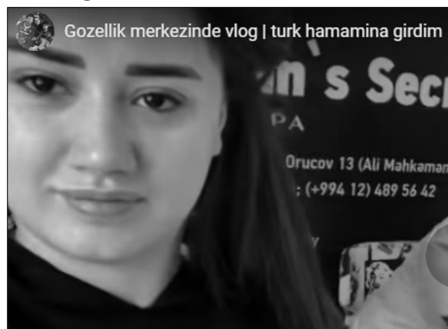
Gozellik merkezinde vlog | turk hamamina girdim