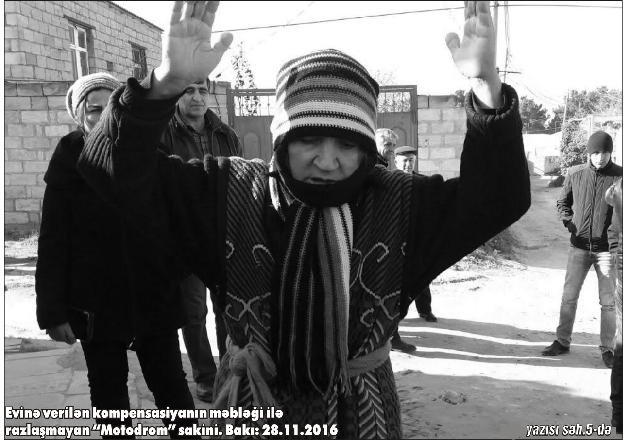
Evinə verilən kompensasiyanın məbləği ilə razılaşmayan "Motodrom" sakini. Bakı: 28.11.2016

"Motodrom" adlanan yaşayış massivinin sakinləri iddia edir ki, onlara verilməli olan kompensasiyanın məbləği iki dəfədən çox azaldılıb; üstəlik, qiymətləndirmə şirkətinin adı gizlədilir