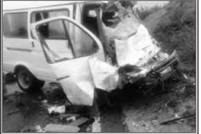
Gədəbəy rayonunda ağır yol qəzası baş verib.

"Report"un Qərb bürosunun məlumatına görə, hadisə Şəmkir-Gədəbəy avtomobil yolunda qeyd alınmış. Şəmkir rayonunda qəzaya uğrayan mikroavtobusun sürücüsü hadisə yerində ölüb. Məlumatla görə, qəza rayonun "Yasamal aşırımı" adlanan ərazisində baş verib. Hadisə nəticəsində 14 nəfər səmşinin isə müxtəlif bədən xəsarətləri alıb. Yaralıları xəstəxanaya yerləşdirilib. Məlumatla görə, mikroavtobus toy karvanında hərəkət edirdi.