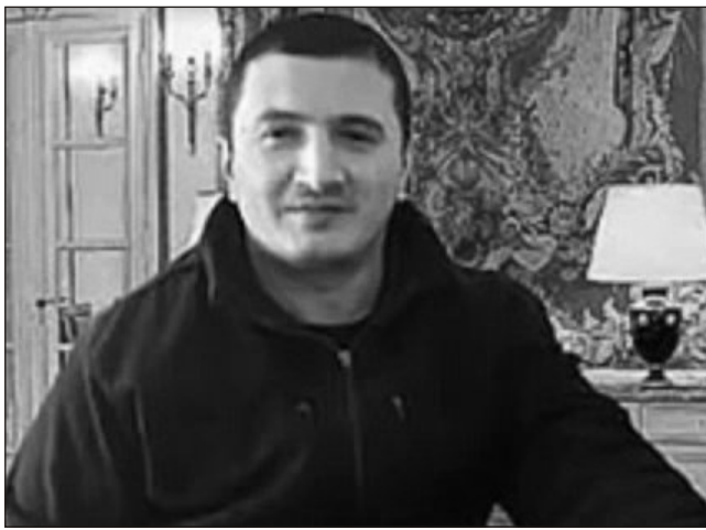
Sverdlovsk əyalətində "Lotu Quli"nin adamları xüsusi biznes məkanlarına və bazarların böyük qisminə nəzarət edirlər, bu isə...

Hazırda Rusiya hüquq-mühafizə orqanları güman edirlər ki, yaxın gələcəkdə Uralda kriminal qruplaşmalar arasında yeni müharibə olacaq. Bu səbəbdən əyalətə yeni polis rəisi təyin edilib. Regionun hüquq-mühafizə orqanları açıq bildiriblər ki, onlar