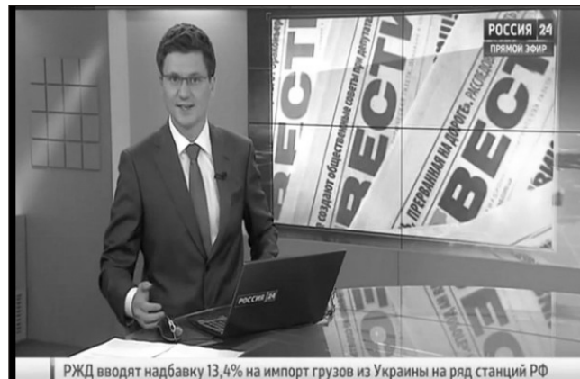
РЖД вводит надбавку 13,4% на импорт грузов из Украины на ряд станций РФ

lar heç də Rusiyada keçiriləcək idman yarışlarından əskik deyil. Bakıda keçiriləcək İslam Həmrəyliyi Oyunları, ümumiyyətlə, İslam ölkələri tarixində ilk kütləvi idman tədbiridir. Zənnimcə, həmin televiziya bu oyunlar haqqında da mütləq məlumatlar yaymalıdır. Əgər yaymırsa, bu, Azərbaycana qarşı informasiya blokadasının bir formasıdır. Yəni onlar Azərbaycanı təbliğ etmək, ölkəmizin böyük tədbirlərə ev sahibliyi etməsi ideyası-