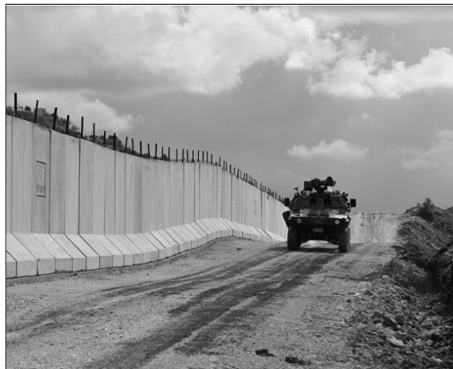
yan bir məsələdir".

metr hündürlükdə beton divar hürüləcəyi barədə məlumat yaymışdılar: "Amma rəsmi mənbələr xəbəri nə təkzib, nə də təsdiq etdilər. Ola bilsin ki, belə bir plan var. Amma hazırda bu planın gerçəkləşdirilməsi Türkiyə üçün prioritet məsələ deyil. Çünki hazırda Türkiyəyə ən böyük təhlükə Suriyadan gəlir. Suriya ilə sərhəddə divar hövrülməsi həm qanunsuz miqrasiyanın, həm terror qruplarının Türkiyə ərazisinə keçməsinin qarşısının alınmasına, həm də sərhəd bölgəsində yaşayan insanların kiçik çaplı silahların hədəfi olmaqdan qorunmasına xidmət edir. Bu baxımdan da Suriya ilə sərhəddə divar hövrülməsi Türkiyə üçün alternativ olma-