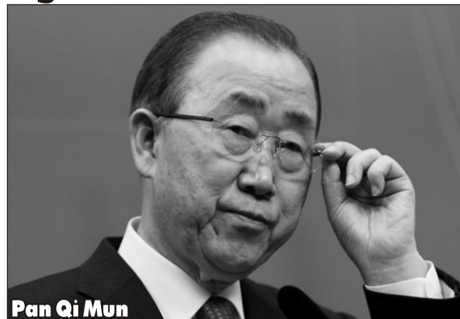
Pan Qi Mun

APA-nın "SBS News"-a istinadən verdiyi xəbərə görə, Koreyanın "Sisa Journal" nəşrinin məlumatına əsasən, Pan Qi Mun 2005-ci ilin yazında Koreyada səfərdə olan Vyetnam XİN rəhbərinin şərəfinə təşkil edilmiş ziyafət zamanı 200 min dollar rüşvət alıb.