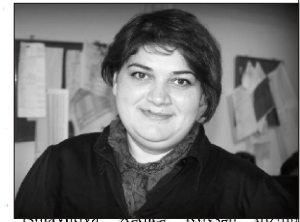
İsmayilova Xədicə Rövşən qızının Azərbaycan Respublikası CM-nin 179.3.2., 192.2.2., 213.1., 308.2., 125-ci maddələri ilə təqsirləndirilməsinə dair 152006031 №-li cinayət işi üzrə