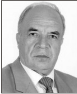
Sosioloq: "Planlaşdırma düzgün aparılmır"

və sənin mütəxəssisliyin uyğun olduğu bir yerdə işləyib, qazanırsan. Orta məktəbi bitirəndə hamı sevinir və hesabat verilir ki, tutaq ki, 150 min şagird məzun oldu. 150 min şagirdin hamısı ali məktəbə qəbul ola bilməz. Çünki o qədər iş ehtiyatı yoxdur. Ali məktəbə müəyyən miqdarda qəbul qoyulur. Hətta keçən il deyildi ki, ali məktəbə qəbul planı qoyulmıyacaq. Amma iş məsələsi artıq