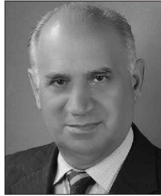
Təhsil eksperti: "Qəbul bəzi ixtisaslarda tələbatdan daha çoxdur"

və sənin mütəxəssisliyin uyğun olduğu bir yerdə işləyib, qazanırsan. Orta məktəbi bitirəndə hamı sevinir və hesabat verilir ki, tutaq ki, 150 min şagird məzun oldu. 150 min şagirdin hamısı ali məktəbə qəbul ola bilməz. Çünki o qədər iş ehtiyatı yoxdur. Ali məktəbə müəyyən miqdarda qəbul qoyulur. Hətta keçən il deyildi ki, ali məktəbə qəbul planı qoyulmıyacaq. Amma iş məsələsi artıq