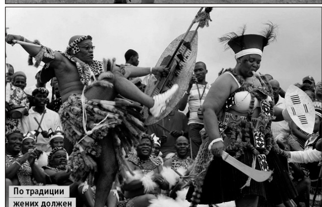
По традиции жених должен