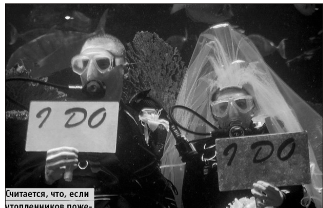
Считается, что, если утопленников поже-

Yakob Zuma - Afrika Milli Konqresinin yeni lideri öz toyunu köhnə Afrika ənənələri ilə keçirib. O və dördüncü hə-