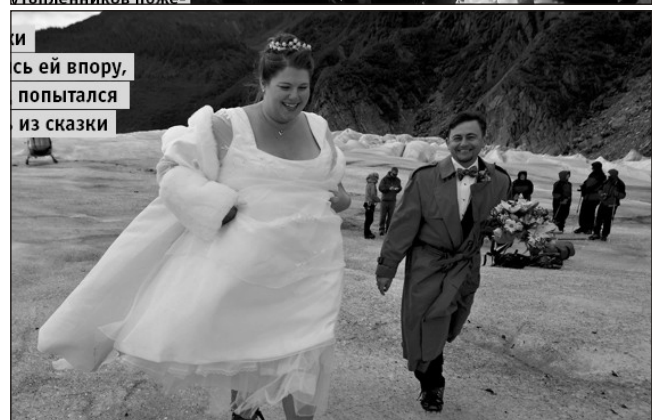
и сь ей в пору, попытался из сказки