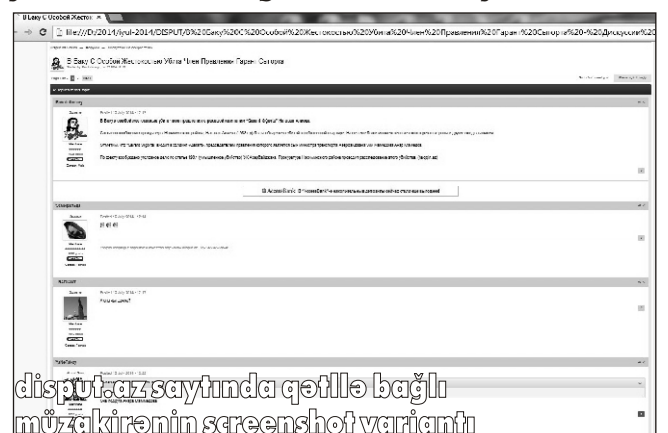
disput.az saytında qətlə bağlı müzakirənin screenshot variantı