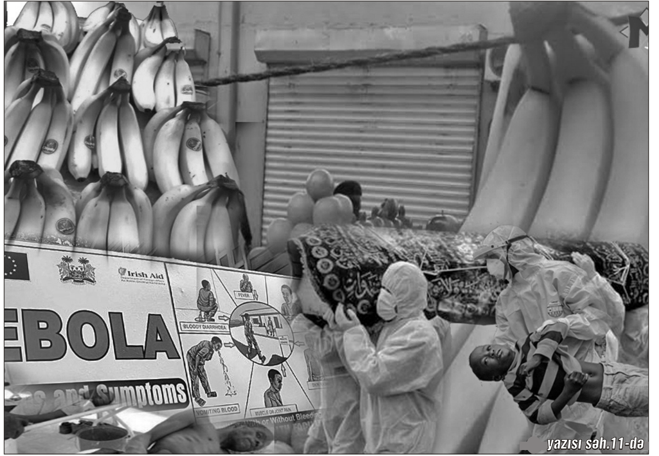
● yazısı səh.11-də

Ölkənin baş pidiatrinin açıqlaması generalın biznesinə itkilər yaşada bilər; Afrika ölkələrində yetişdirilən bananda öldürücü virusun olmasına dair deyilənlər iqtisadi mafiyaların bir-birinə qarşı savaşı da ola bilər; sayıe artıq işini görüb - alıcılar tərəddüd içində, satıcılar isə narahatdır