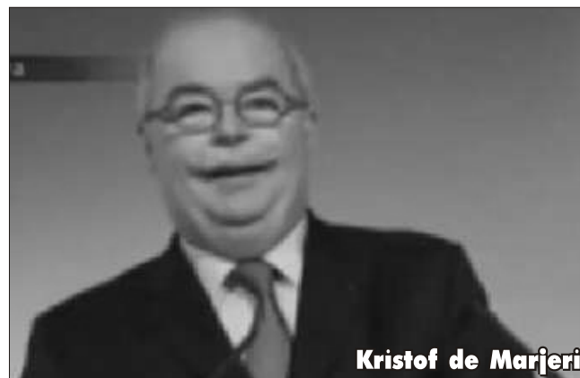
Kristof de Marjeri

Yeri gəlmişkən, “Total”ın prezidenti Rusiyaya qarşı Qərbin sanksiyalarına qarşı olub və şirkət Rusiyada ən böyük xarici investordandır. K.Marjeri oktyabrın 20-də Moskvada təşkil olunan Xarici İnvestisiyalar Üzrə Məşvərət Şurasının toplantısında iştirak edib.