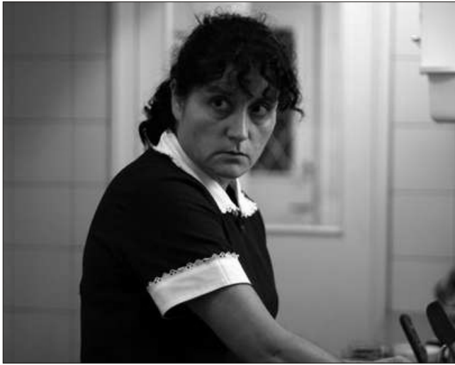
yılı olduğu iddia edilən adamın satışa çıxarılması biabırçılıq, rəzalətdir". İndoneziyanın əmək naziri

"Satışa çıxarılmış indoneziyalı xidmətçi üçün" 3500 rinqqit, yeni 1150 dollar tələb olunurdu. Bundan sonra isə facebook və twitter-də minlərlə malayziyalı həmin elanı yayıb, indoneziyalıları təhqir ediblər. İndoneziyanın XIN başçısı Marti Nataleqava malayziyalı həmkarına zəng vuraraq bu biabırçı olaydan çox sinirləndiyini bildirib: "İndonezi-