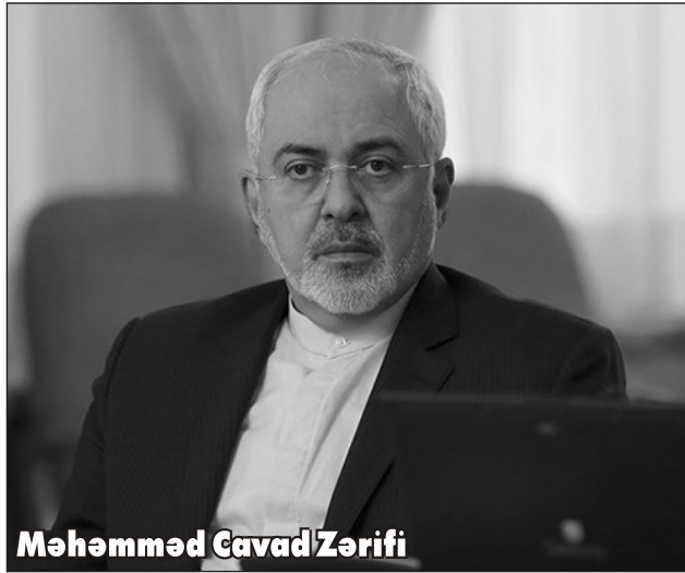
Məhəmməd Cavad Zərif

İranın xarici işlər naziri Xocalı faciəsi ilə bağlı mövzuda niyə fikir bildirmədi?