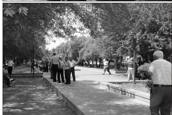
bə məcburdur kirayə mənzil tutsun. Amma hansı pulla?.."

□ Ləman MUSTAFAQIZI, "Yeni Müsavat"