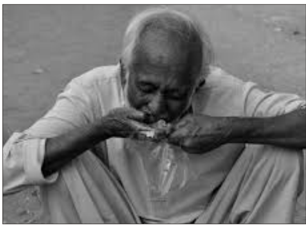
Səhifəni hazırladı: SELCAN

Kasıblıq insanın bir çox xüsusiyyətlərini əlindən alır. Belə ki, gündəlik olaraq kasıblıqla mübarizə aparan insanın dost çevrəsi və əqli qabiliyyəti azalır. Yaşam qayğılarını həll etməli olan şəxs təhsil, yeni iş yerlərinin tapılması ilə bağlı düşüncəsinin qarşısını alır. Bununla da onun düzgün olmayan qərarlar verməsinə, öz situasinya daha da pisləşdirməsinə səbəb olur. Amerikalı alimlərin gəldiyi bu nəticə "Science" jurnalında dərc edilib. Alimlərin yazdığına görə, yaşam dərdi insanların mütaliə və düşünmə qabiliyyətini də əlindən alır. Belə ki, xərcləri artan, bəzi bataqlığında üzən, kreditlərini necə verməli olduğunu düşünen şəxsin intellektual səviyyəsi də 13 faiz aşağı düşür. Müəlliflər hesab edir ki, kasıbların durumunu yaxşılaşdırmaq üçün səfərbər olan xeyriyyə qurumları onların əqli qabiliyyətinin aşağı düşməsinə də bir çarə tapmalıdır. Bunun üçün bəzi kursların təşkili çıxış yolu kimi göstərilib.