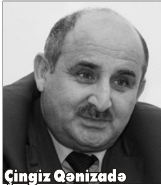
Çingiz Qenizadə duqlarını bilmədiyini vurğulayıb və bunun qanunsuz olduğunu