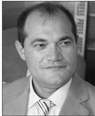
Novruz bayramında növbəti əfv fərmanının gözlənilməli diqqət çəkən ekspertlərin fikrincə, Avropa İttifaqı ilə danışıqların başlanması budəfəki əfv fərmanına mübahisəli siyasi məhsus siyahısında olan şəxslərin adının daxil edilməsinə müəyyən təsir göstərə bilər. Həmin məhsusların buraxılması və siyasi islahatlara başlanılması Azərbaycanla Avropa İttifaqı arasında nəzərdə tutulan sazişin imzalanması prosesini sürətləndirə bilər.

Şərtlərə gəlincə, qeyd olunur ki, bu şərtlər əsasən ölkəmizin Ümumdünya Ticarət Təşkilatına üzvlüyü, siyasi, iqtisadi islahatların həyata keçirilməsidir. Bu şərtlər arasında təbii ki, adı mübahisəli siyasi məhsus siyahısında olan məhkumların da azad olunması var.