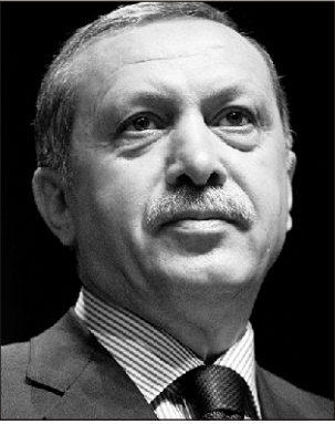
Rəcəb Tayyib Ərdoğan