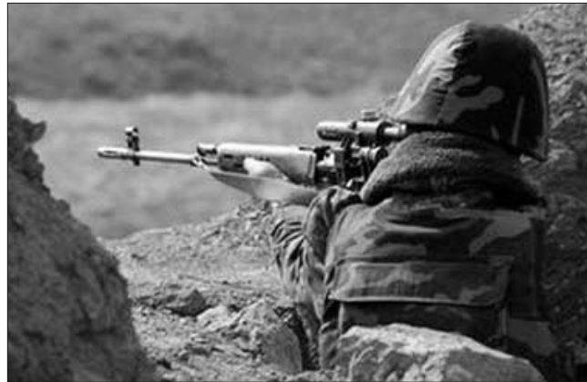
sələ, bu arada belli olub ki, Avropa Parlamentində ermənipərəst "Dağlıq Qarabağ qrupu" fəaliyyətə başlayıb.