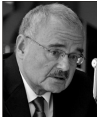
Artur Rasizadə ATƏT-in fəaliyyətdə olan sədrinin şəxsi nümayəndəsi-

Düşmən ölkə atəşkəs rejimini pozmaqda davam edir; Artur Rasizadə : "Ermənistanın münaqişənin həllində tutduğu mövqe məsələnin həllinin qeyri-müəyyən müddətə uzadılmasına səbəb olur"