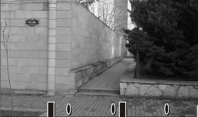
Özevinə görə bələdiyyə ərazisini zəbt edib