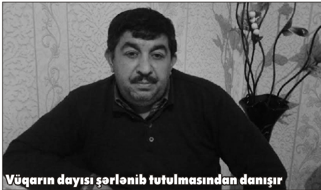
Vüqarın dayısı şərhlənib tutulmasından danışır

Vüqar Əliyevin atası və dayısı sensasion faktlar açıqladılar, Lamiyənin Ruslanı vurduğu bıçağı necə və hardan əldə etdiyi üzə çıxdı; rayonda isə sabiq başçının keflənib mollanı məscidin minbərinə çıxarması və sahibkara zülmündən danışıqlar