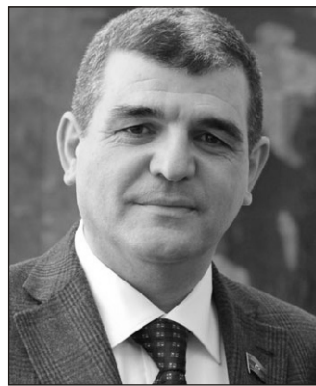
Fazil Mustafa: "Bu ölkənin maraqlarına qarşı olan fikirlərə sərt mövqeyimizi ortaya qoymalıyıq"