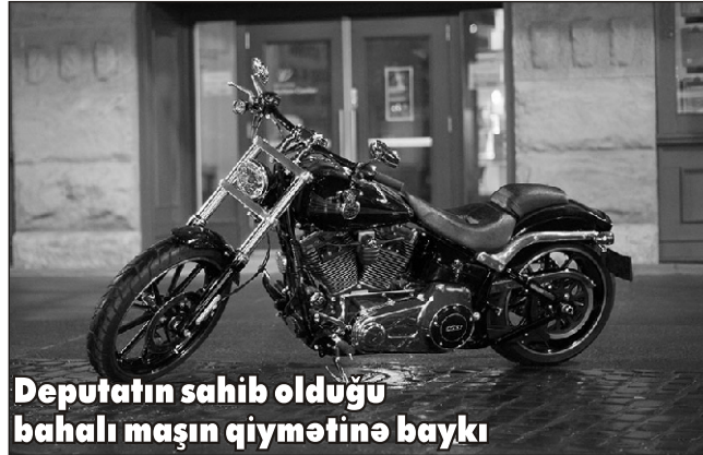
Deputatın sahib olduğu bahalı maşın qiymətinə baykı

Deputatın üzvü olduğu "Baku HOG Azerbaijan" onun motosiklet həvəskarı olduğunu təsdiqləyir, baykerləri qoruyacağını bəyan edir