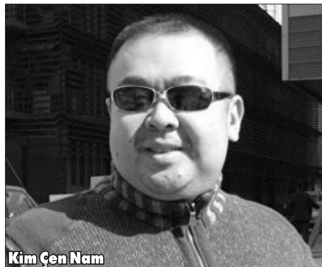
Kim Çen Nam

keçmiş Rusiya casusu - Andrey Luqovoy və Dmitri Kovtunla görüşəndən bir neçə saat sonra özünü pis hiss edib. Qusma və kəskin ağrı simptomları ilə noyabrın 3-də yaşadığı şimali Londondakı yerli xəstəxanaya qəbul edilib. Litvinenkoda radioaktiv zəhərlənmənin əlamətləri var idi. Onun saçları tökülürdü. Lakin həkimlər onu Geyger sayğacı ilə müayinə edəndə, radiasiya qeydə alınmamışdı.