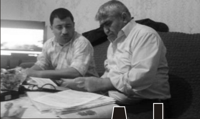
Vüqarın atası ailəyə haqsızlıqlardan danışır