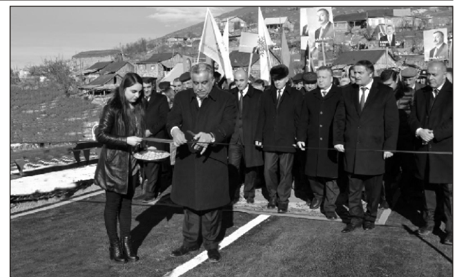
24.12.2015, Daşkəsəndə körpünün açılışı