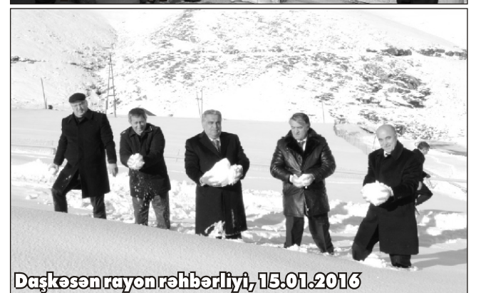
Daşkəsən rayon rəhbərliyi, 15.01.2016