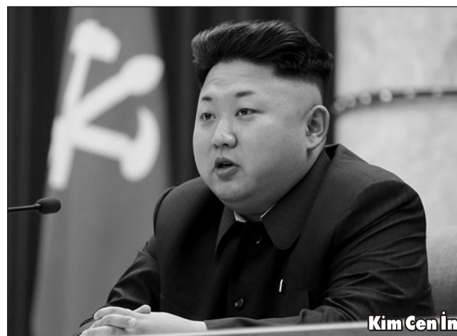
Kim Cen İnin

verib və sonda indi olduğu kimi sakitləşib. Gərginliyin bu şəkildə inkişaf etməsi əslində nə Şimala, nə də ki, Cənuba ABŞ-a sərf edir. Şimali Koreya lideri Kim Cen İnin də, ondan öncəki rəhbərlərin də hədələrini özünüqoruma instinkti adlandırmaq olar. Onlar düşünürdülər ki, təhdidlərlə özlərinə qarşı olan gücləri dayandırmaya məcbur edəcəklər və rejimlərini qoruyacaqlar. Bu taktika hələlik müəyyən qədər özünü doğruldur: "Bu qarşıdurmalarda ilk gündən ABŞ-n xüsusi rolu olub. Bilirik ki, Cənubi Koreyanın təhlükəsizliyinə qarant ABŞ-dır. Bunu bütün imkanları ilə indiyə qədər həyata keçirib. Eyni zamanda bu müddət ərzində Cənubi